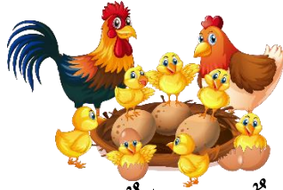
دَجَاجَةٌ وَ دِيكٌ وَ فِرَاحُهُمَا